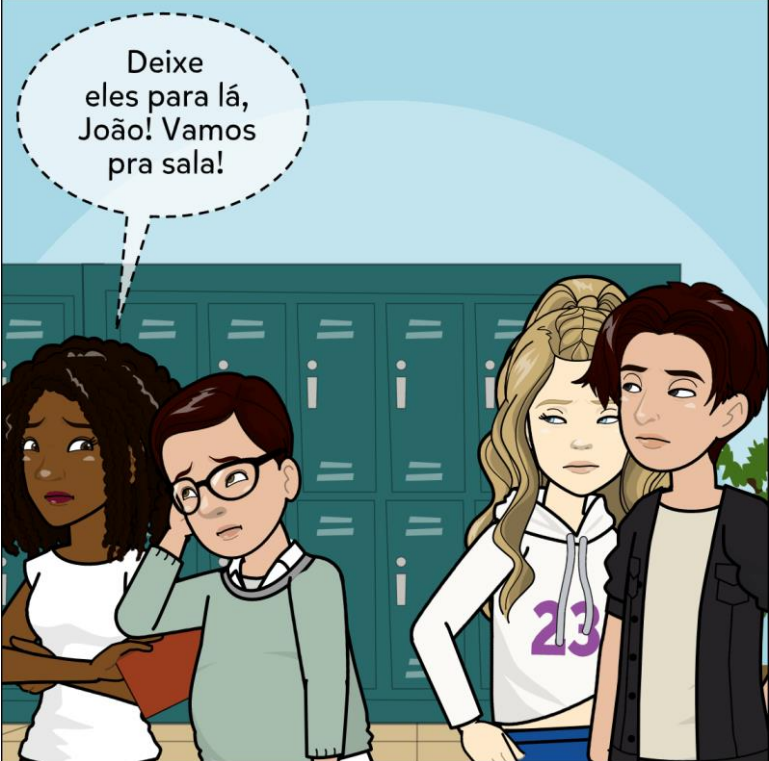
Na sala de aula.